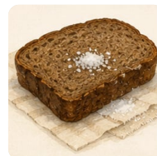
хлеб с солью