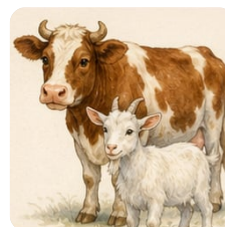
корова и козёл