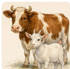
корова и козёл