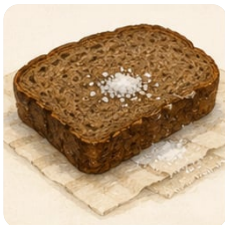
хлеб с солью