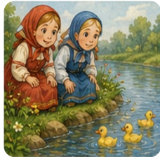
Люба и Оля