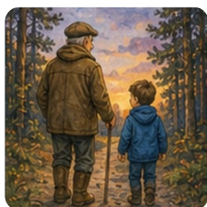
Ваня и дед