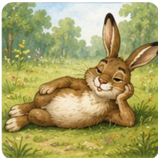
Заяц на боку