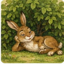
Заяц под кустом