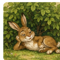
Заяц под кустом